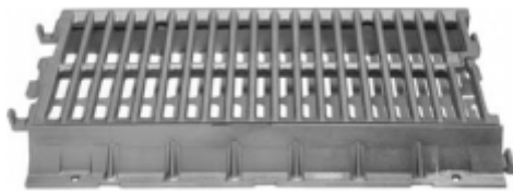
AQUA - V1000